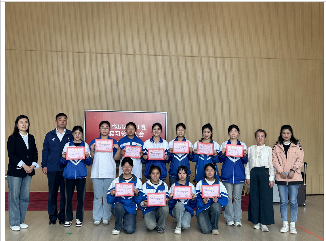
园、校双方领导、老师和优秀实习学生代表合影