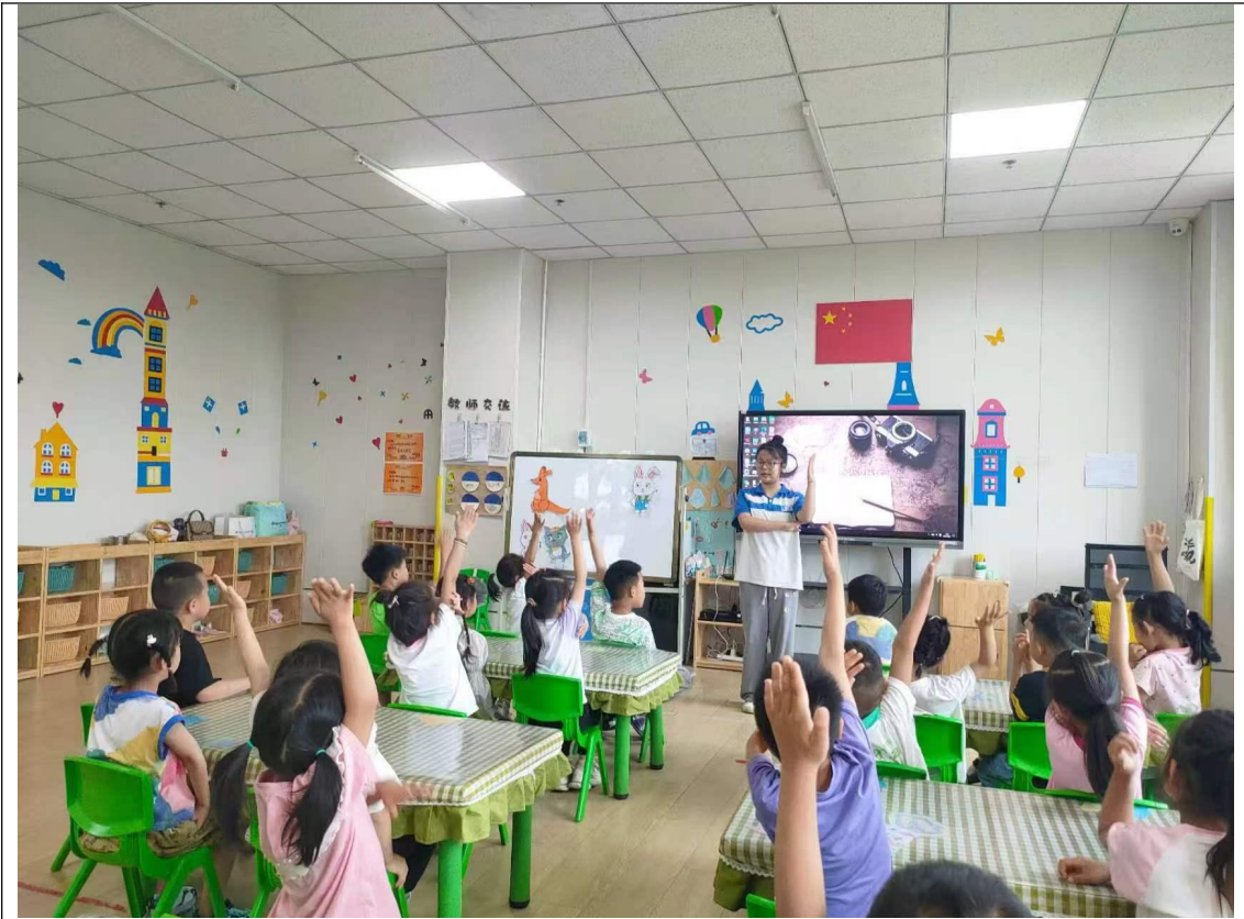
我校幼儿保育专业学生到带领正定新区第二幼儿园小朋友一起做游戏