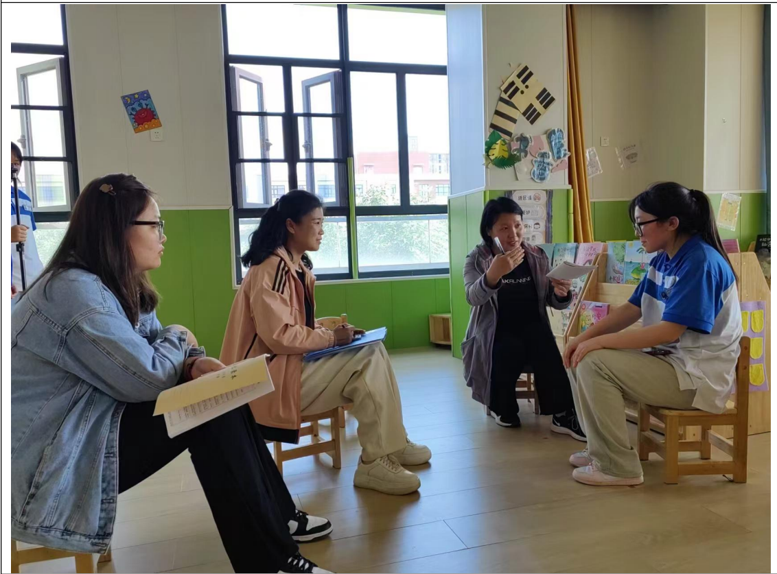
幼儿园教师和学校指导教师共同对实习学生进行现场针对指导